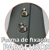
Forma de fixação: PARAFUSOS