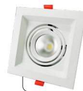
CORPO EM AÇO E ALUMÍNIO, DIFUSOR EM POLICARBONATO